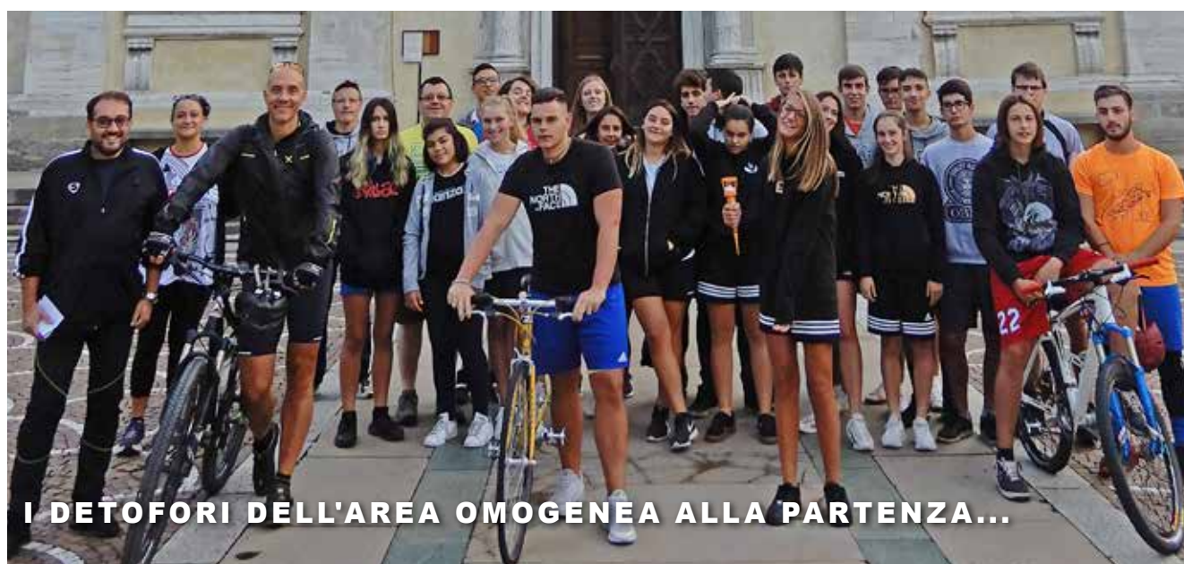
I DETOFORI DELL'AREA OMOGENEA ALLA PARTENZA...