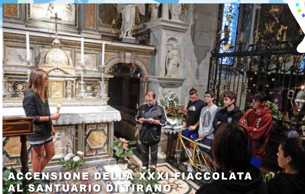
ACCENSIONE DELLA XXXI FIACCOLATA AL SANTUARIO DI TIRANO