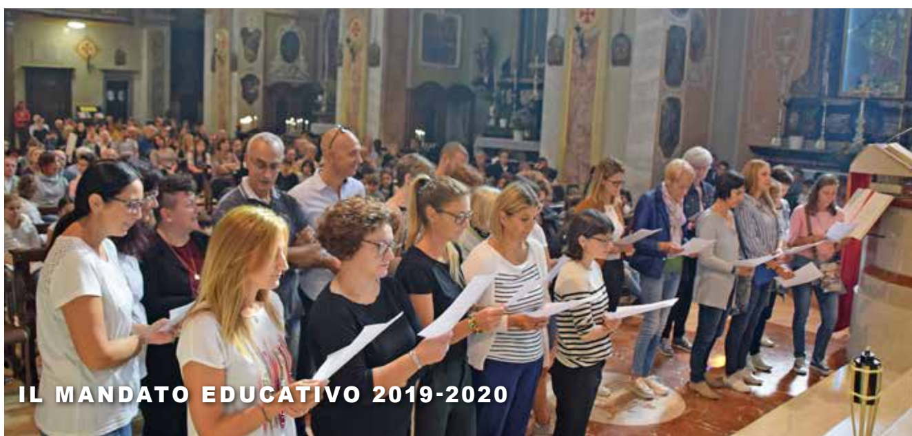
IL MANDATO EDUCATIVO 2019-2020