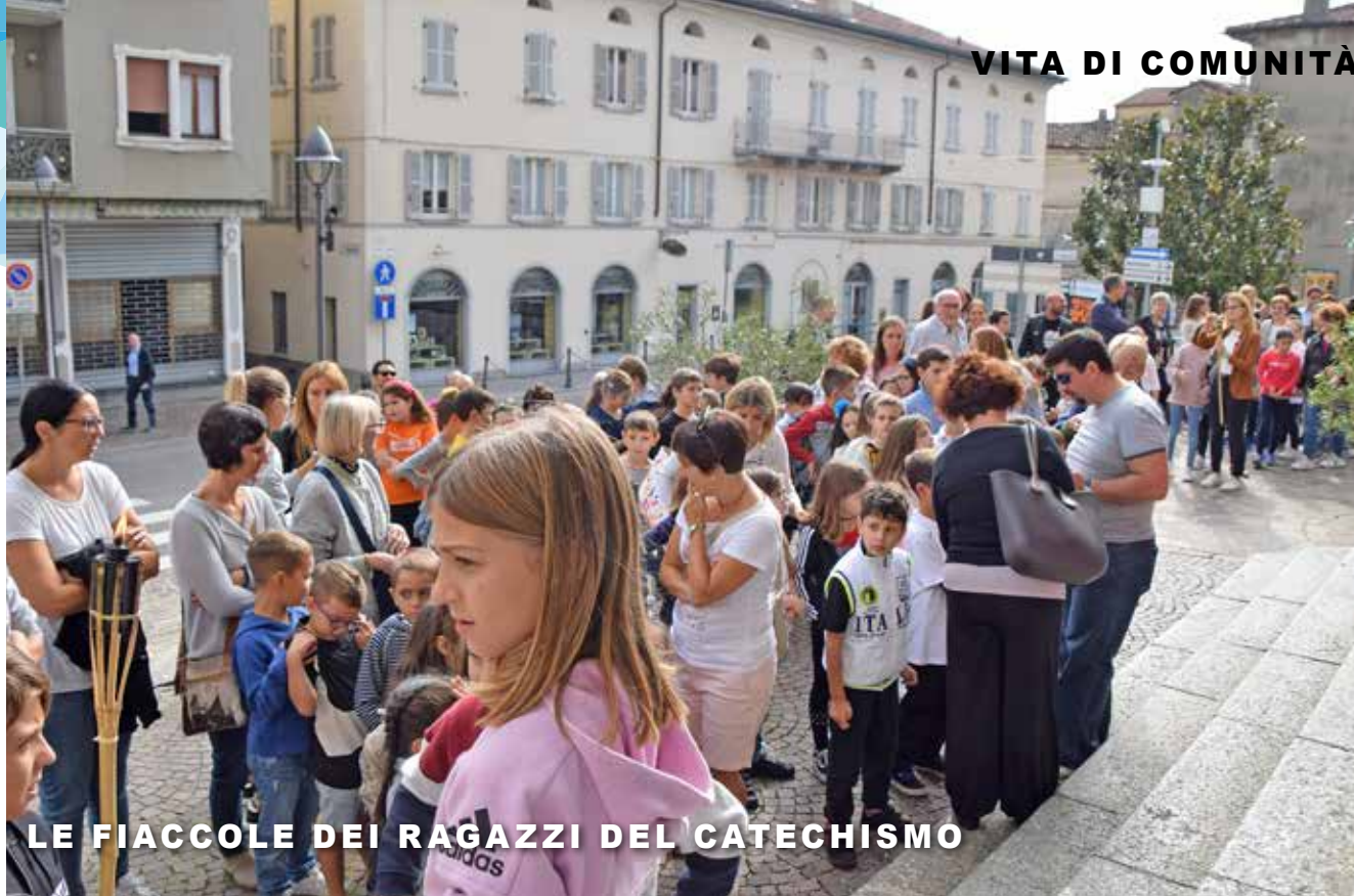
LE FIACCOLE DEI RAGAZZI DEL CATECHISMO