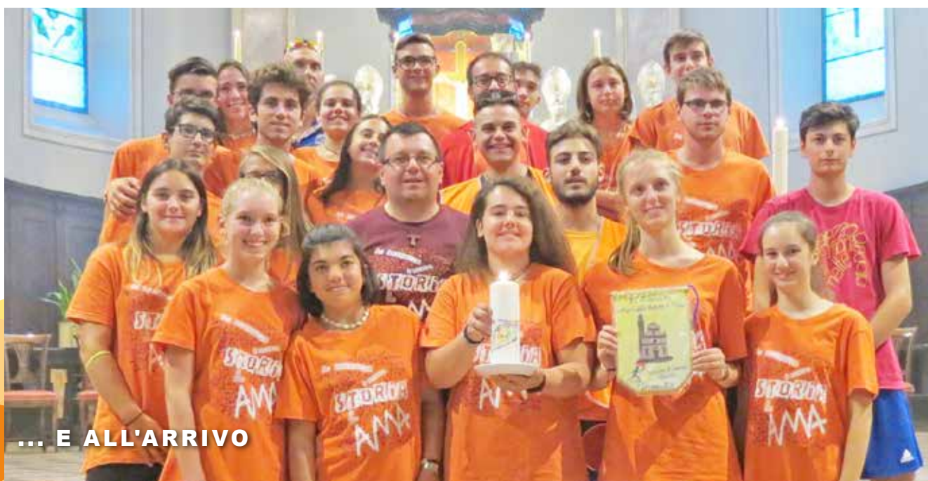
... E ALL'ARRIVO