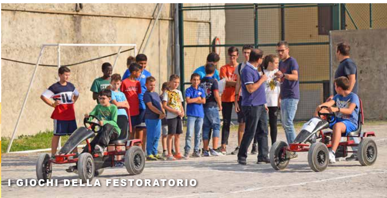
I GIOCHI DELLA FESTORATORIO