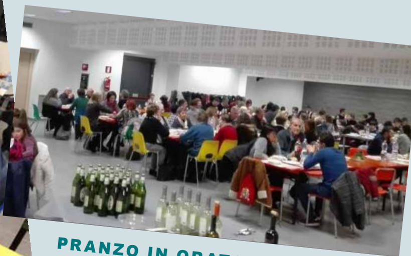
PRANZO IN ORATORIO PER LA FESTA DELLA FAMIGLIA