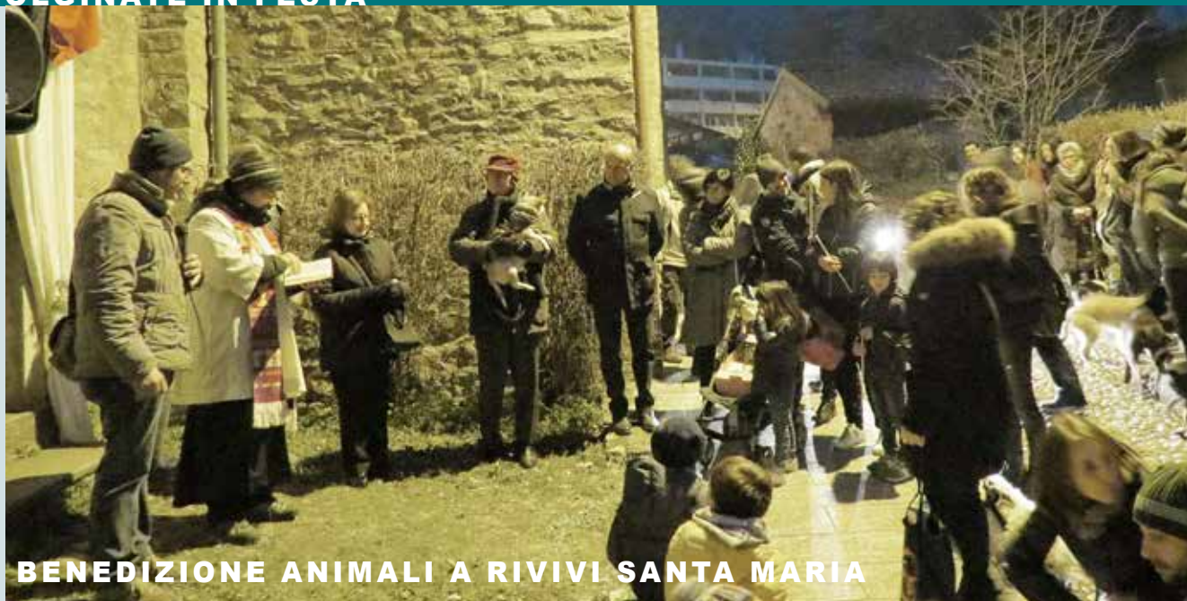
BENEDIZIONE ANIMALI A RIVIVI SANTA MARIA