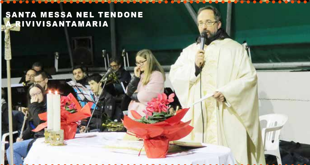
SANTA MESSA NEL TENDONE A RIVIVISANTAMARIA