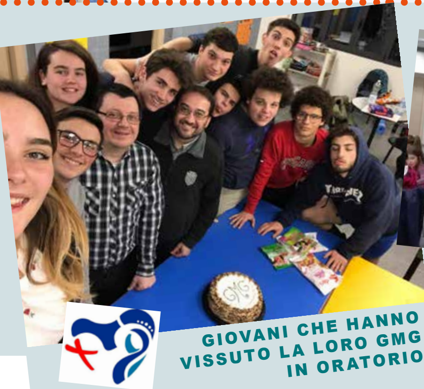
GIOVANI CHE HANNO VISSUTO LA LORO GMG IN ORATORIO