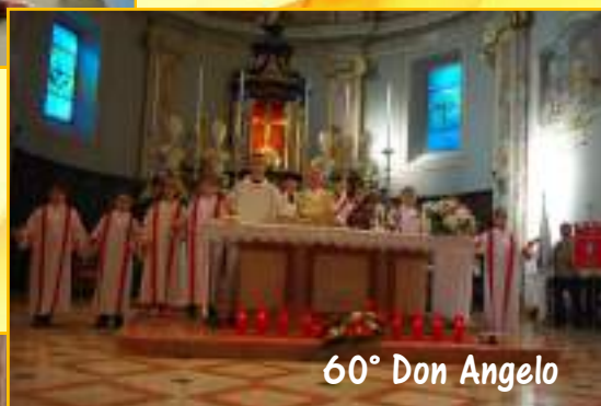
60° Don Angelo