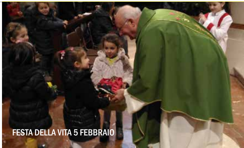
FESTA DELLA VITA 5 FEBBRAIO