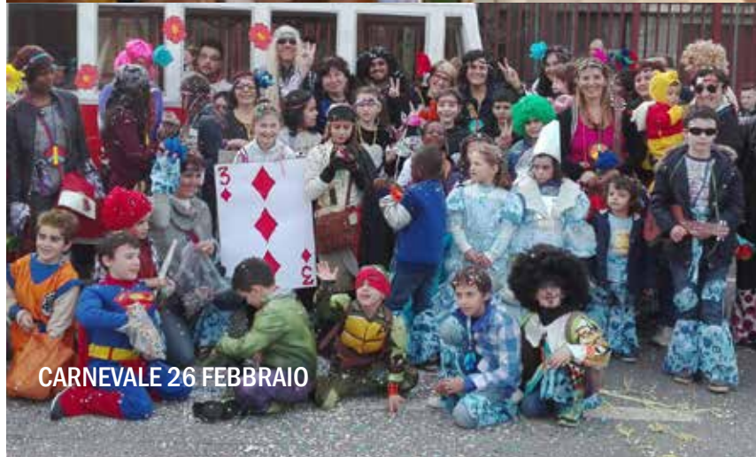
CARNEVALE 26 FEBBRAIO