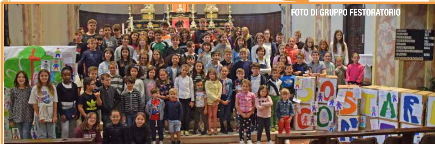
FOTO DI GRUPPO FESTORATORIO