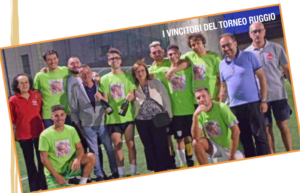
I VINCITORI DEL TORNEO RUGGIO