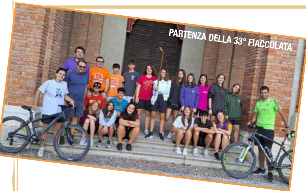
PARTENZA DELLA 33° FIACCOLATA