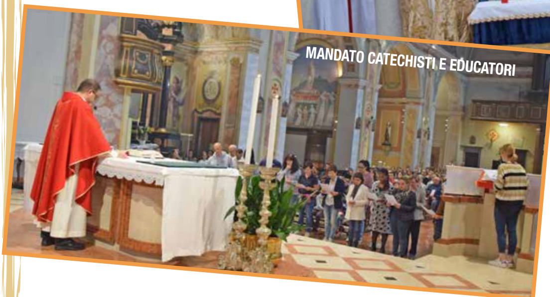
MANDATO CATECHISTI E EDUCATORI