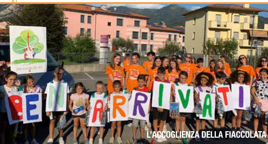
L'ACCOGLIENZA DELLA FIACCOLATA