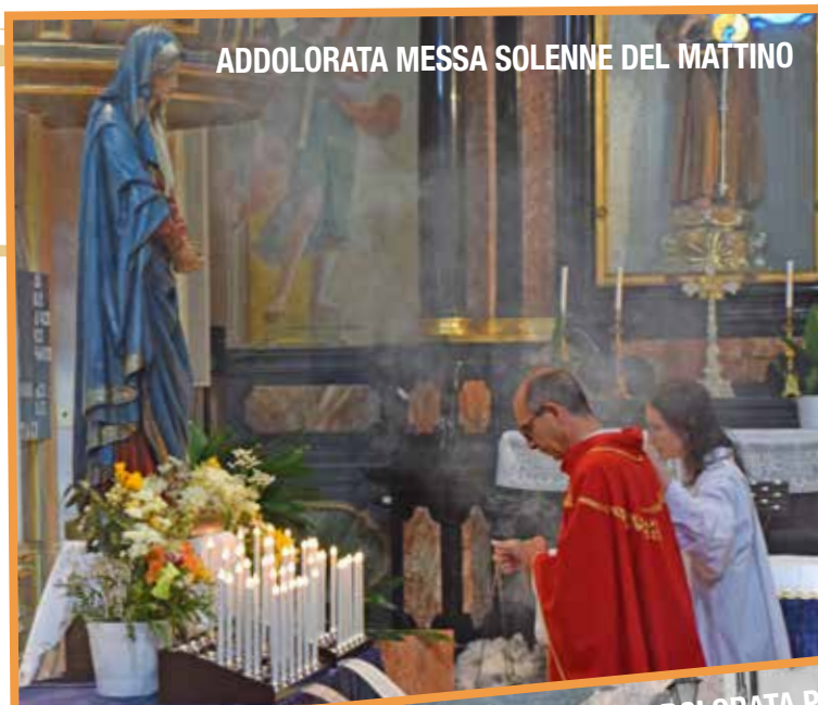
ADDOLORATA MESSA SOLENNE DEL MATTINO